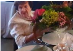
Homenaje Sra. de Casajuana