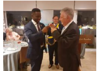
Cambio de collares

Cuarenta años de existencia de un club como el nuestro, el Rotary Club de Barcelona Pedralbes, no son pocos, porque representa tener una actividad fuera de lo común. Un club que dispone de un gran patrimonio, es decir, sus socios. Que han contribuido, durante todos estos años, desde 1983, con su esfuerzo, sus acciones y sus proyectos, en hacer de Rotary una organización humanitaria imprescindible para el servicio de la sociedad. El club, a través de todos estos años, se ha convertido en una herramienta fundamental en el beneficio social, y que gracias a sus Presidentes, Maceros, y demás miembros de las diversas juntas, entre todos, han concretado el alma y la base de que el club, nuestro club, tenga una presencia esencial en nuestra comunidad. Todo un honor y satisfacción de sus socios. Para la crónica completa del 2 de junio, así como reportaje fotográfico ver la edición especial 40 Aniversario del Massana.