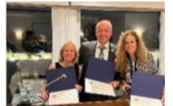
Entrega 3 PHF