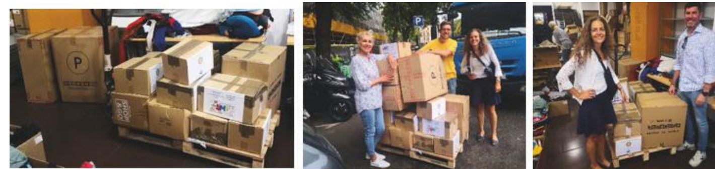
Imágenes de la entrega de ropa y juguetes

El pasado día 21 de junio hemos podido entregar los 100 pares de zapato infantil de verano nuevos de una conocida marca, para edades de 4 a 14 años, respondiendo así a la