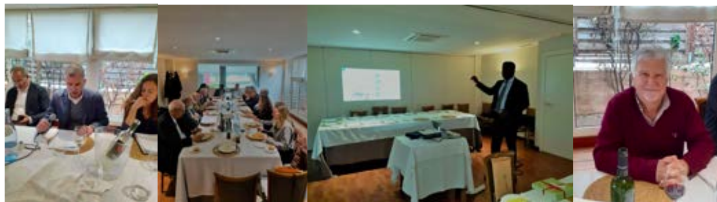
Imágenes en el transcurso de la Asamblea