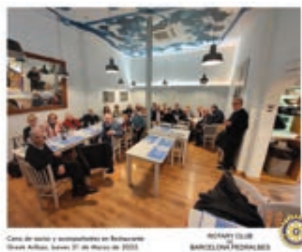
Cena de socios y acompañantes en Restaurante "Dionisios" jueves 31 de Marzo de 2022