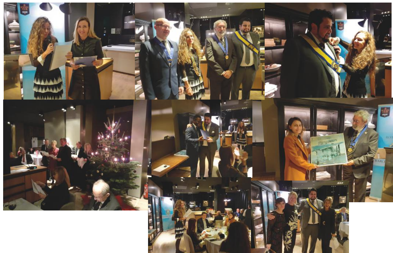
Imágenes del transcurso de la cena

Las navidades siempre han sido unas fechas muy señaladas para compartir, con la familia, con los amigos y los seres queridos, todo lo bueno que podemos dar. Porque dar es recibir. Poder compartir nuestras inquietudes en un encuentro con los buenos amigos, representa un enriquecimiento personal que nunca olvidaremos. Rotary es un ejemplo a seguir, y máxime en estas fechas, y prueba de ello fue el encuentro que mantuvo el club en esta pasada cena de Navidad.