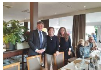
Miembros del Jurado con la Presidenta