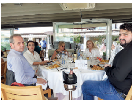
Socios del Club durante la comida