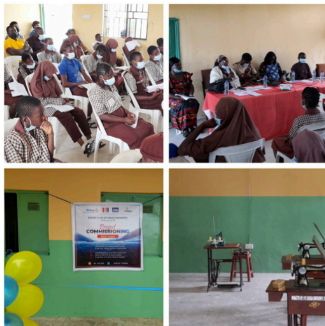
Imágenes del proyecto

El Rotary Club Abuja-Gwarinpa es uno de los principales clubes en Abuja, la capital de Nigeria. Como ya explicamos en una edición anterior del Massana, hemos decidido realizar un proyecto Global Grant con este club.