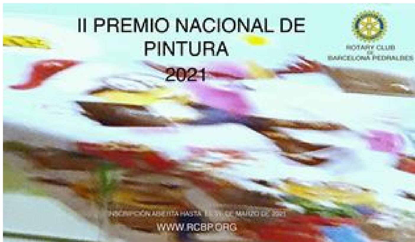
Cartel del Premio 2021