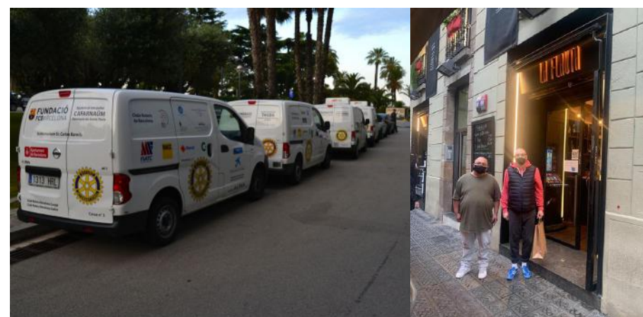
Voluntarios de La Caixa

Los 1.000 euros aportados nuevamente por nuestro club el pasado mes de diciembre al proyecto distrital ALPAN , se han convertido en 720 bocadillos adquiridos en el restaurante La Flauta , que se han entregado al comedor solidario El Caliu (en la foto, voluntarios de La Caixa en acción).