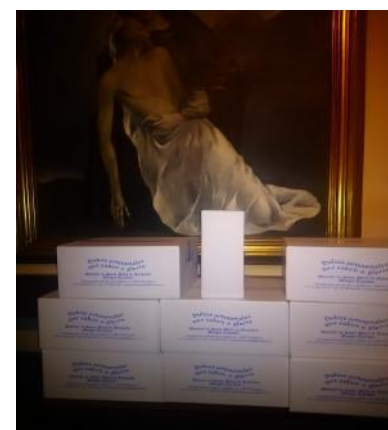
Entrega Galletas a la Parroquia de Santa Anna