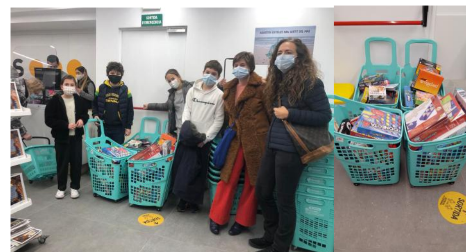
Imagen de grupo

Gràcies al vostre suport, aquest any podrem aconseguir que molts infants de l'Associació Educativa Itaca puguin gaudir d'un regal!