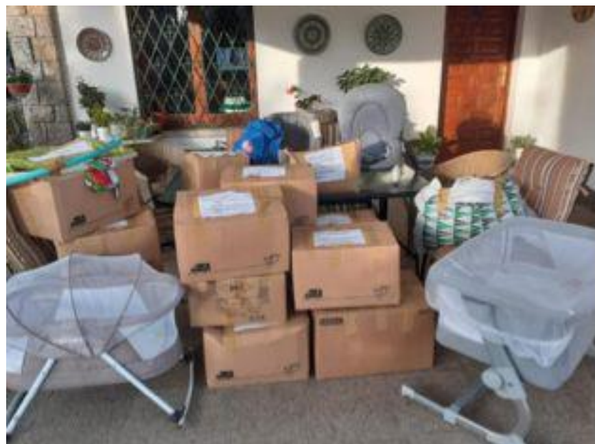
Entrega ropa a Itaca els vents