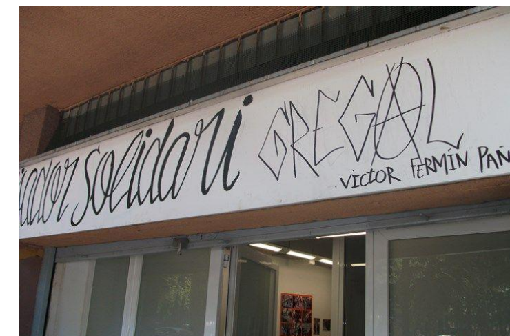
Menjador Solidari Víctor Fermín

Pronto hará siete meses que debido a la pandemia que padecemos, el proyecto ALPAN se ha visto obligado a reinventarse. A falta de donaciones de hoteles y restaurantes, actualmente Rotary suministra alimentos (pollo, pescado y bollería) - en parte son partidas donadas por empresas de la alimentación - a los siguientes comedores sociales de Barcelona que están operativos y que disponen de cocina: El Caliu, Santa Tecla, Sant Fèlix de Àfrica, El Xiringuito de Dios, Canpedró y El Gregal-Víctor Fermín . El comedor