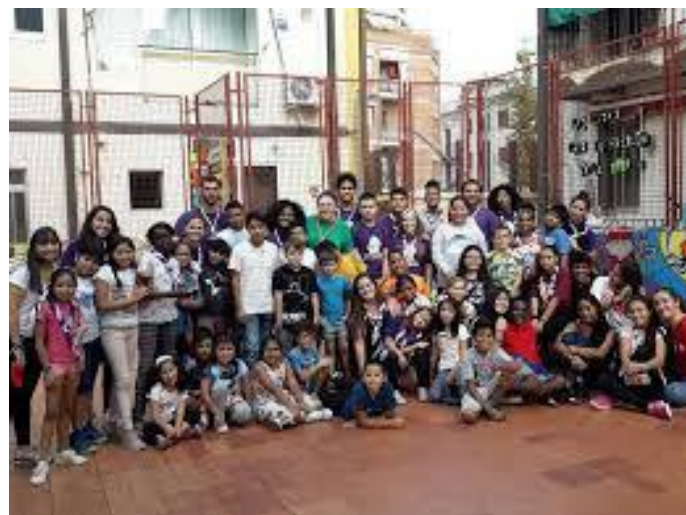
Grupo de niños y monitores de Itaca els Vents