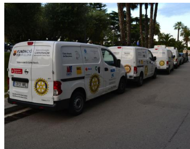
Furgonetas Proyecto ALPAN