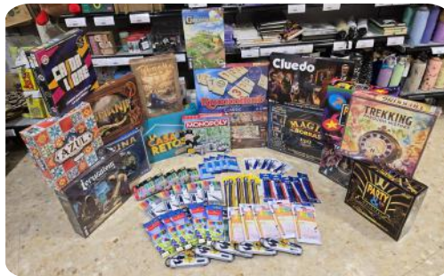
Regalos a estrenar para Reyes