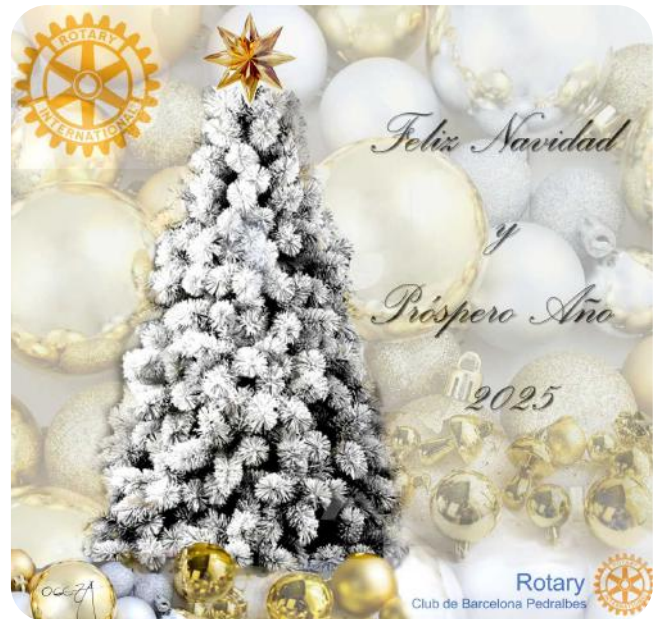
Diseño: Jaume de Oleza