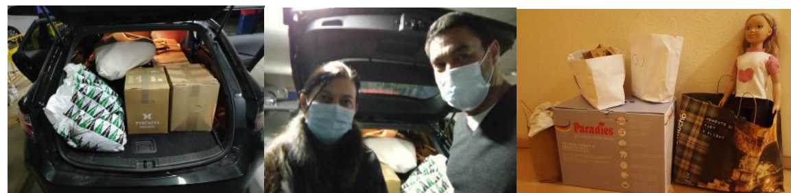
Entrega de la donación