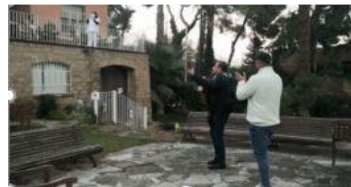
Actuación Yumitus del Pichón

El Grupo Mimara apuesta por el entretenimiento y diversión en sus centros a través de la música en directo. Esta vez, una de sus residencias en poder disfrutar de todo ello fue Pedralbes Park que, el 16 de diciembre y con la colaboración del Club Rotary de Pedralbes, recibió la visita del grupo 'Yumitus del Pichón'. Durante el concierto se interpretó un repertorio de música variada, donde destacaron canciones de rumba catalana y, como no podía ser de otra