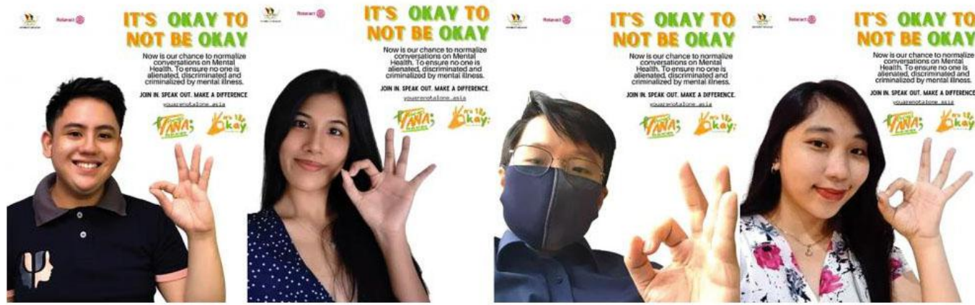
Los rotaractianos del sudeste asiático crearon carteles digitales para difundir su iniciativa de salud mental multiclub.

Los ganadores de los Premios a los Proyectos Sobresalientes de Rotaract 2020-2021 se anunciaron el mes de abril y se celebraron durante la preconvención virtual de Rotaract en junio. Los clubes y distritos Rotaract de 63 países propusieron una cifra récord de 675 proyectos de servicio, los cuales fueron evaluados por el personal de RI y los miembros del Comité de Rotaract en función de criterios como la sostenibilidad, la evaluación de las necesidades de la comunidad, la promoción, el impacto dentro de las áreas de interés de Rotary, la participación de varios clubes Rotaract y la colaboración con rotarios y expertos locales. Se eligieron dos proyectos como galardonados internacionales y seis como galardonados regionales.